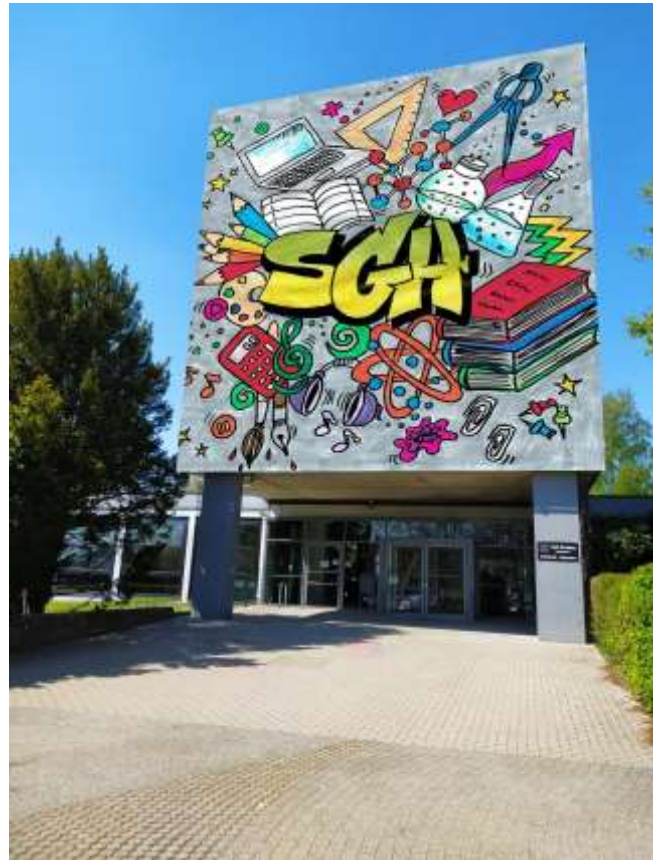
Entwurf: Tim Berger